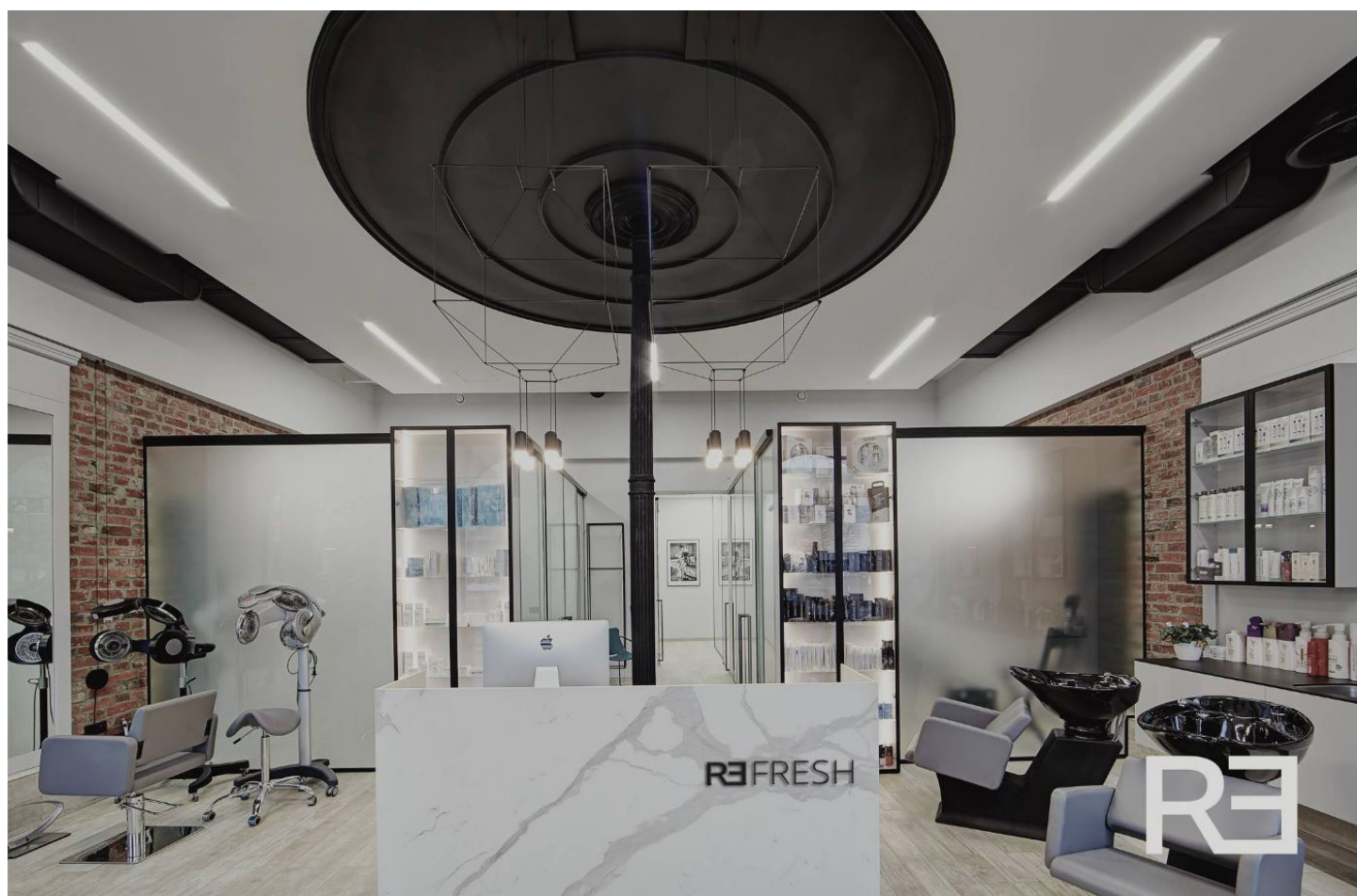
Refresh cosmetics hair salon, Poland.