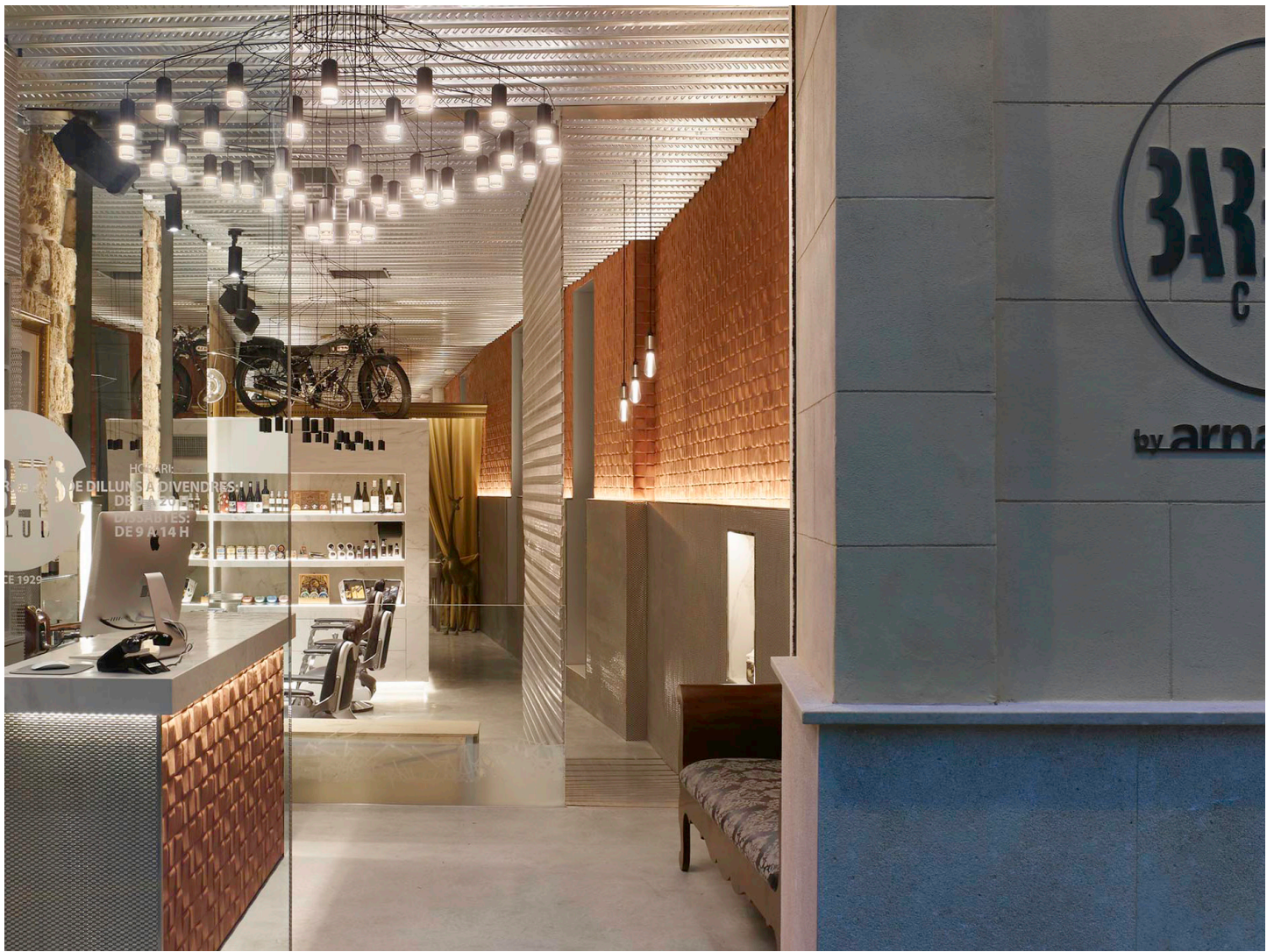
The Barber's Club. Designed by Minimal Studio.