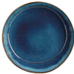
OPRAH Plato de postre de gres (21,7 cm; 7,90€)