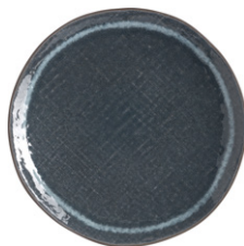
ORIANNA Plato de postre azul de porcelana (21,6x2,3 cm; 10,90€)