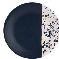
OFELIA Plato llano de gres (28 cm; 12,90€)