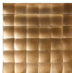
OSAKA Bandeja deco cuadrada de aluminio dorado (30x30x5 cm; 39€)