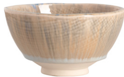
OPALE Bol de gres (16,8x8,2 cm; 8,90€)