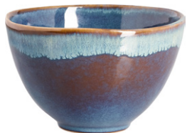
OPRAH Bol de gres (14x8,8 cm; 5,90€)