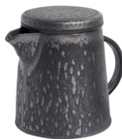
MATCHA Cafetera con filtro de gres (L.13,1 x l.10 x H.12 cm; 39€)