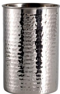
HAMMERED Bote para utensilios inox (11 x H.16,5 cm; 11,90€)

Para comedores y cocinas con un toque de glamour, la colección Chicago de Habitat proporciona una propuesta sofisticada y funcional a la vez. Materiales Art Déco como los metales, el vidrio y el gres se trabajan mediante técnicas artesanales para crear piezas de diseño vanguardista y elegancia atemporal. Los tonos dorados se combinan con colores oscuros y otros más atrevidos como el rosa y el azul brillante ipara presentar las comidas en gran estilo!