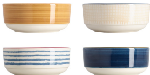
OSCAR Set de 4 Bols de loza (17 x 23cm; 22,90€)