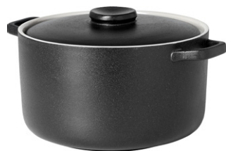
OWEN Olla de gres (L.28 x l.21 x H.12 cm; 35€)