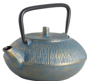
ORPHEE Tetera de hierro colado (19x8 cm; 29€)