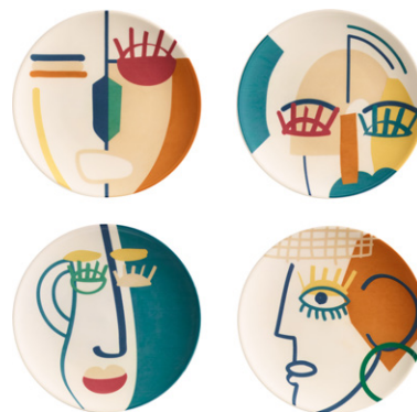
OSCAR Set de 4 platos de postre de gres (23x8 cm; 19,90€)