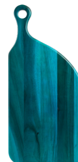
OCARINA Tabla de corte de acacia (L.33 x l.15 x H.2 cm; 14,90€)

Para comedores y cocinas con un toque de glamour, la colección Chicago de Habitat proporciona una propuesta sofisticada y funcional a la vez. Materiales Art Déco como los metales, el vidrio y el gres se trabajan mediante técnicas artesanales para crear piezas de diseño vanguardista y elegancia atemporal. Los tonos dorados se combinan con colores oscuros y otros más atrevidos como el rosa y el azul brillante ipara presentar las comidas en gran estilo!