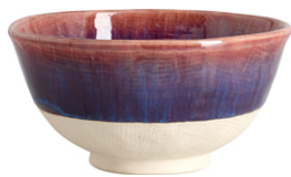
OPALE Bol de gres (16,8x8,2 cm; 8,90€)