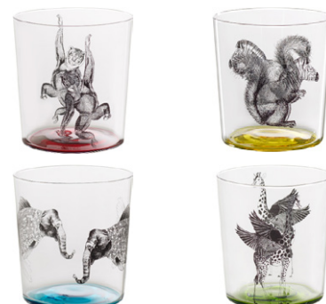
Vaso alto de cristal 350 ml - 4,90€