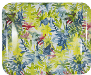
Bandeja de melamina rectangular 35 x 25 cm - 14,90€