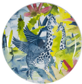
Plato de poste de melamina 21cm - 4,90€

El mundo de la flora, de la fantasía, de lo onírico y de las criaturas fantásticas ha sido fuente de inspiración para crear Luna , una colección que evoca un sutil surrealismo a través de formas de animales fantásticos. Es un juego de composiciones con un efecto sorprendente lleno de luz, frescura y candor.