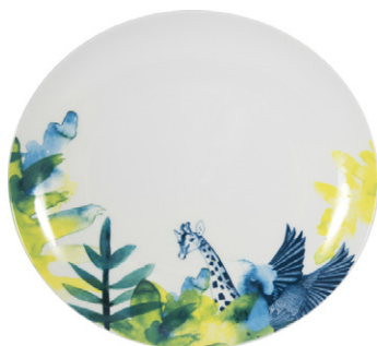
Plato llano de porcelana bone chine 27cm - 18,50€