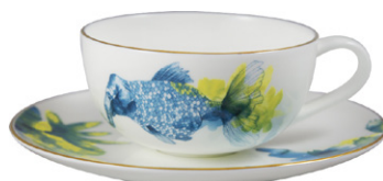
Taza de café con plato de porcelana bone chine 9,50€