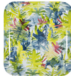
Bandeja de melamina cuadrada 25 x 25 cm - 9,90€