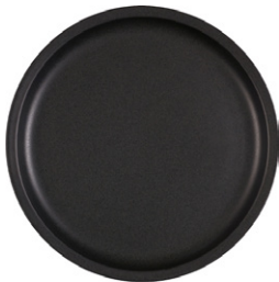
LEONIE plato llano de gres 26,5 cm - 10,90€