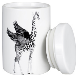
LUNA tarro de lazo 15,90€