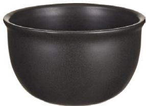
LEONIE bol de gres 12,5 cm - 8,90€