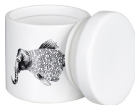
LUNA tarro de lazo 11,90€