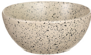
ALBANE bol de gres 16cm - 5,90€