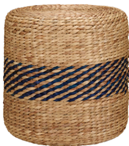
NILO Puf de fibra Natural. (40x40x40 cm; 79€)