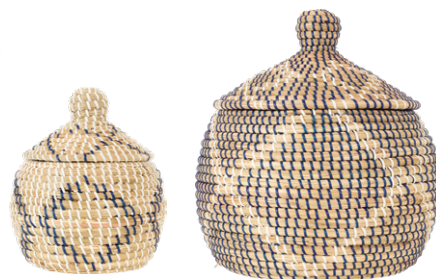
NATALINA Lote de 2 cestas de junco de mar con tapa. (58€)