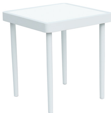
VENETIE Mesa auxiliar de jardín de aluminio y vidrio templado. (45x45x50 cm; 149€)