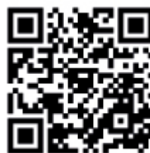
Código QR Apple iTunes