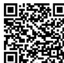
Código QR Google PlayStore

Destacan los originales Vídeos de instalación y uso . Una completa selección de vídeos dirigida a profesionales de la reforma del baño que facilita la comprensión del funcionamiento e instalación de las Soluciones Geberit.