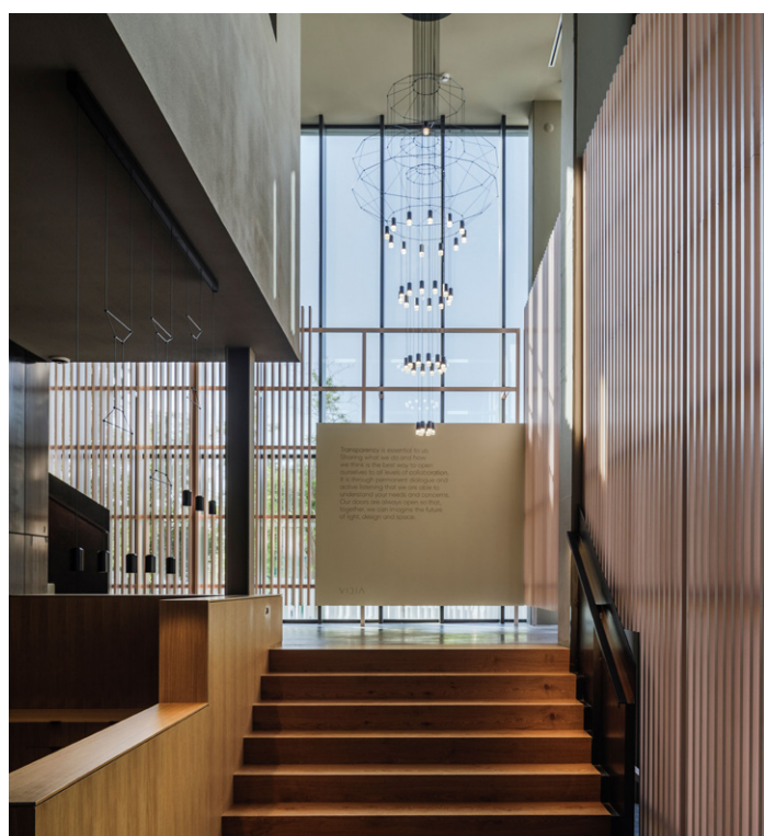
La luminaria Wireflow Chandelier diseñada por Arik Levy preside el espacio de recepción a triple altura e imprime representatividad.

El proyecto de interiorismo de la recepción y showroom ha sido realizado por Francesco Rifé Studio . La entrada principal es una declaración de principios: luminosidad, juegos con la luz, transparencia, reverencia al espacio arquitectónico. Rifé dota el espacio de bienvenida de una celosía de madera rosada que lo envuelve como protección climatológica y visual. El cromatismo suaviza el espacio a triple altura, manteniendo su representatividad. El acceso hacia el showroom combina nítidas estructuras vde hierro.