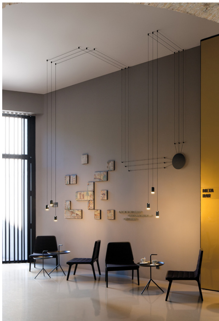
Wireflow lamp designed by Arik Levy

Con tan solo un enchufe, esta luminaria puede configurarse en infinidad de formas y alturas en cualquier espacio, pudiéndose elegir entre las versiones de uno a nueve puntos de luz LED a instalar en la pared o el techo.