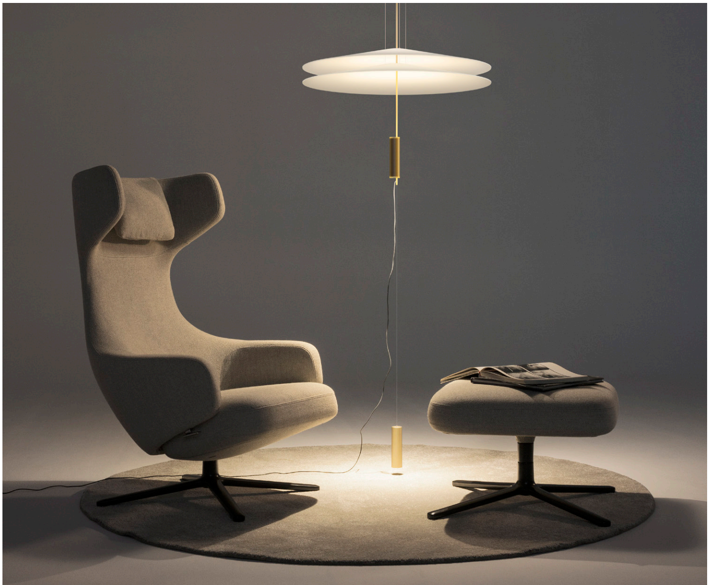
Flamingo lamp designed by Antoni Arola